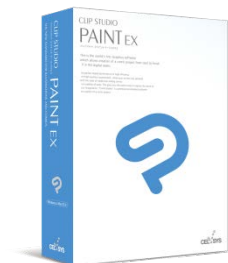
CLIP STUDIO PAINT EX