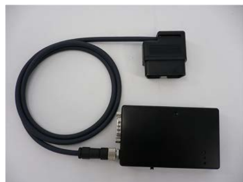
ZMP カートモ UP PRO

この度の協業により、「カートモ UP PRO」とUIコンダクター間の通信が可能になるため、実車の OBD II 端子からUIコンダクターへ速度や回転数をはじめとするCAN情報のデータを容易に取り込むことができるようになり、UIコンダクターで作成したHMIへこれらのデータを反映させるこ