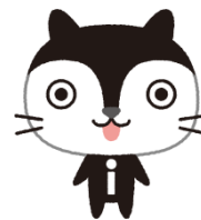
マスコットキャラクター iエネくん

エイチアイは、生活者視点の調査・分析・ガイドライン・プロトタイプング・仕様・開発に関する取組みに対しての実績を持ち、上流から下流のサービスおよび開発までを一貫して実施することが可能であることや、独自のユーザビリティテストを実施する環境、ノウハウを有しており、HEMS 関連サービスについて、利用者が親しみやすいユーザーインターフェース実現のためのサービス企画からシステム開発までを提供した実績があります。