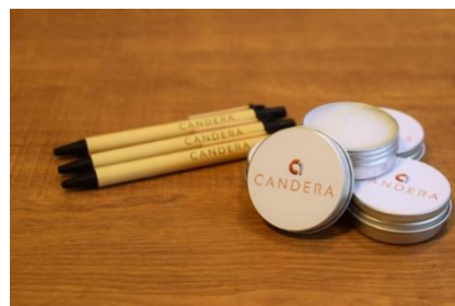
オリジナルボールペン・キャンドル

また、ご来場いただいた方には先着順でオリジナルボールペンまたはキャンドルを差し上げます。「Candera Japan Inc. - Embedded HMI Design」の看板を目印に、ぜひ、カンデラブースへお越しください。