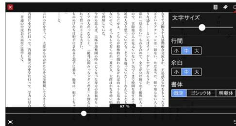
文字サイズ、行間、余白、書体の設定が可能